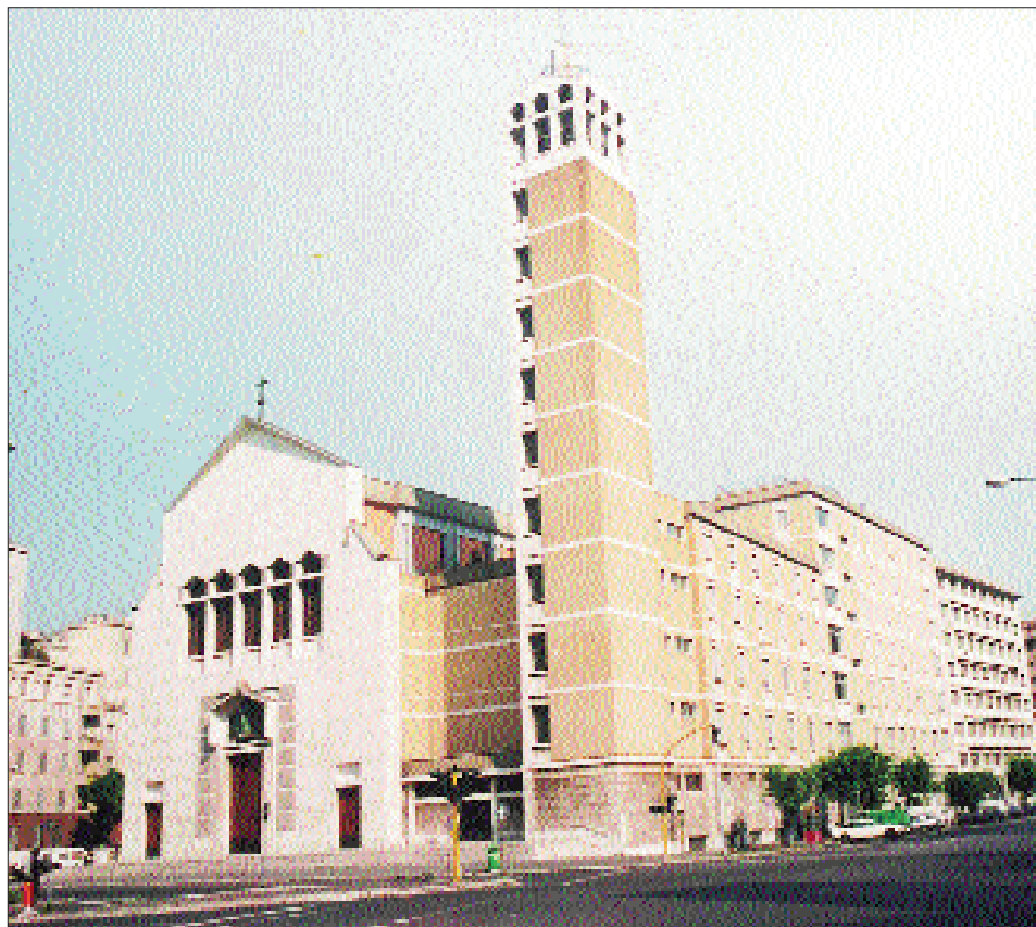
1. Roma - Curia Generalizia