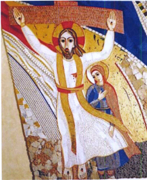
Votos de uma Santa Pascoa

Via Tuscolana, 167 - 00182 Roma Tel. 06.7020751 - Fax 06.7022917 e-mail: segrgen@rcj.org