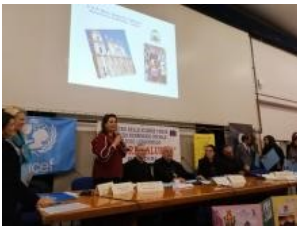
Convegno su Sant'Annibale a Brindisi