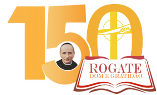
150° dell'Ispirazione del Rogate