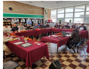
Annuale Assemlea della Delegazione Nostra Signora di Guadalupe.