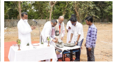
Laying of the founda- tion stone of Rogationist Academy School, Aluva