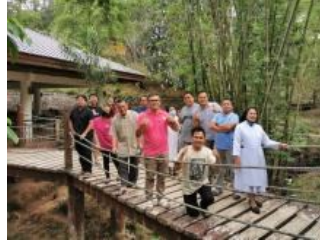
Ongoing formation: Bartimeus Experience