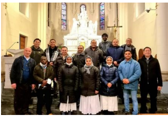
Pellegrinaggio Mariano all'inizio della Quaresima

Pregate dunque il Signore della messe perché mandi operai nella sua messe (Mt 9,38 - Lc 10,2)