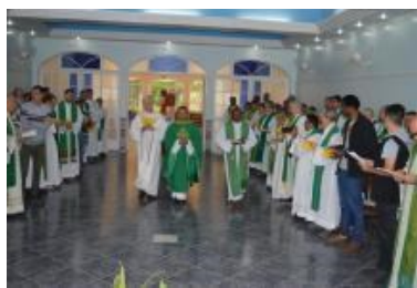
Assemblea della Provincia San Luca