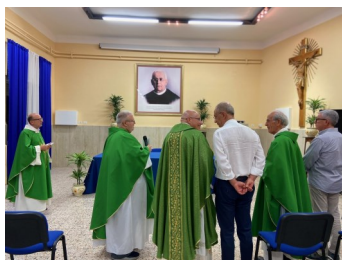
Oria - 89° della morte di Padre Palma