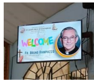
Visita Canonica alla Provincia San Matteo