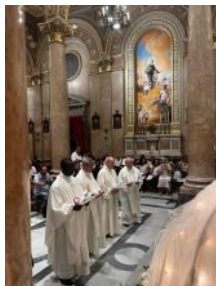
Messina Professione Perpetua e Voto del Rogate

Pregate dunque il Signore della messe perché mandi operai nella sua messe (Mt 9,38 - Lc 10,2)