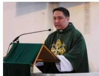
Mons. Rene Ramirez Vescovo Ausiliare di Melbourne