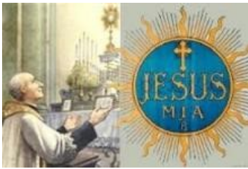
Nel SS. Nome di Gesù

Pregate dunque il Signore della messe perché mandi operai nella sua messe (Mt 9,38 - Lc 10,2)