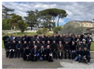
Assemblea delle Province Italiane