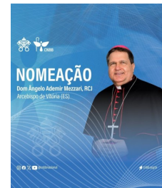
Dom Angelo Arcebispo de Vitoria