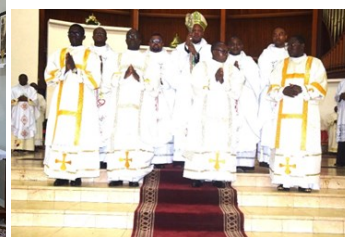
4 Presbiteri e 4 Diaconi a Yaounde (Cameroun)