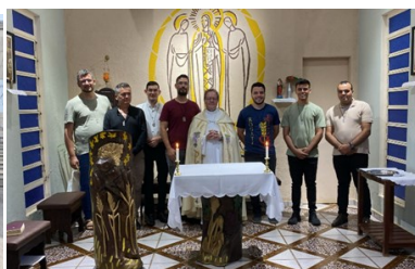
Ingresso au Noviciado in Brasilia