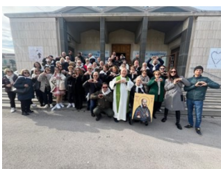
San Francesco di Sales festeggiato a Trani

Pregate dunque il Signore della messe perché mandi operai nella sua messe (Mt 9,38 - Lc 10,2)