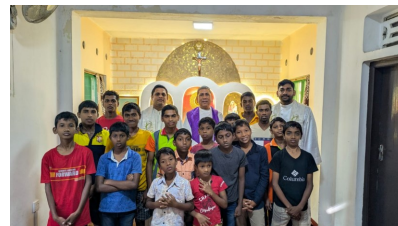
Apta consultatio alla Quasi Provincia San Tommaso