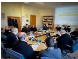
Visita del Padre Generale alla Provincia Sant'Annibale

Pregate dunque il Signore della messe perché mandi operai nella sua messe (Mt 9,38 - Lc 10,2)