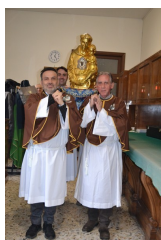
Le reliquie di Sant'Antonio a Roma Piazza Asti