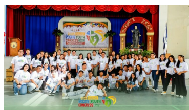
Philippines: 1st National Rogate Youth Congress