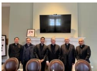
Il Padre Generale incontra il Cardinale di Chicago

Pregate dunque il Signore della messe perché mandi operai nella sua messe (Mt 9,38 - Lc 10,2)