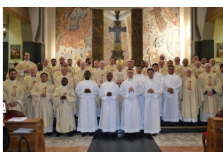
Solemnità di San Giuseppe Conferimento dei Ministeri