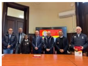
Il Cammino di Sant'Annibale a Messina

Pregate dunque il Signore della messe perché mandi operai nella sua messe (Mt 9,38 - Lc 10,2)