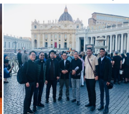
Inizia il Corso di Formazione dei Formatori