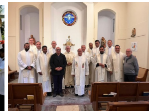
Assemblea Generale della Delegazione Nostra Signora di Guadalupe