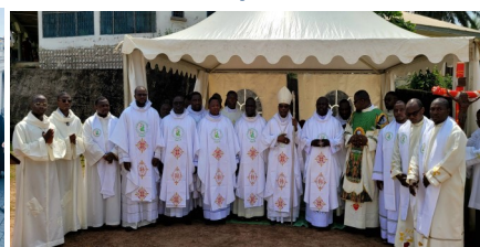
Jubilé d'argent des Rogationnistes au Cameroun Edea